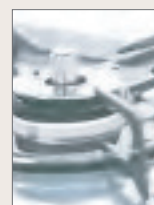
電機・ガスのトラブル