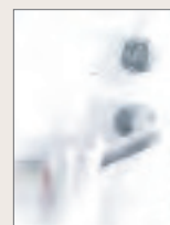
玄関鍵のトラブル