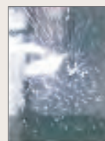
窓ガラスのトラブル